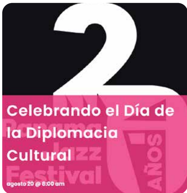
PANAMA JAZZ FESTIVA 2022 20 DE AGOSTO