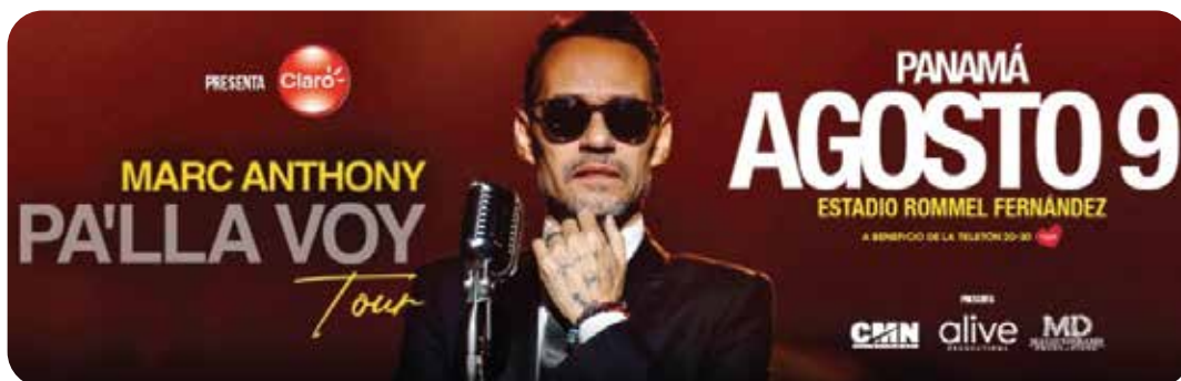
MARC ANTHONY – PA'LLA VOY ESTADIO ROMMEL FERNANDEZ 9 DE AGOSTO