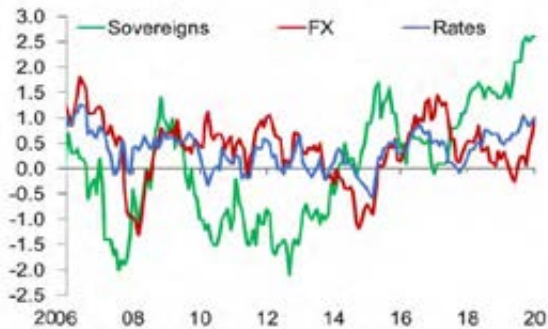
Figure 15. Investor Positioning in Emerging Market Assets (Reported investment position in excess of average in units of standard deviation)

Note: FX = foreign exchange.