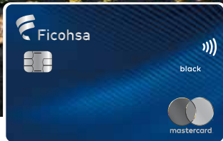
Black Metal Premier Mastercard